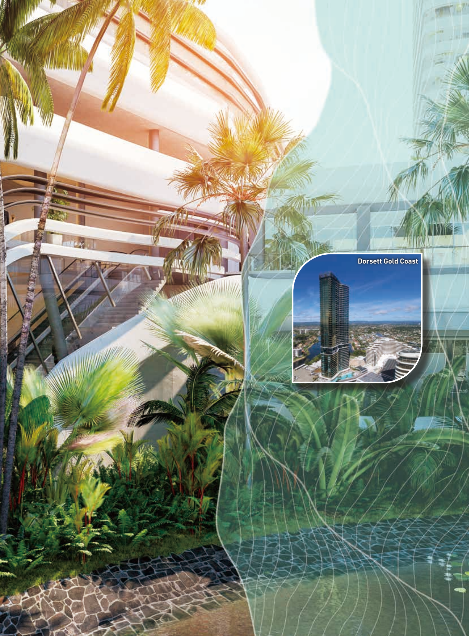
Dorsett Gold Coast