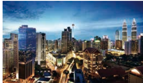
吉隆坡Dorsett Bukit Bintang

Aspen at Consort Place為位於倫敦金絲雀碼頭Marsh Wall之綜合用途發展地盤，已獲取綜合大樓之規劃批文。該發展項目包括總可售樓面面積約478,000平方呎之私人住宅，當中包括約495個住宅單位、139個可負擔房屋單位及一間提供約230間客房之酒店以及商業空間。於二零二三年三月三十一日，就住宅單位錄得預售總值港幣1,300,000,000元。可負擔房屋單位已於二零二二年財年以約43,000,000英鎊預售。預期該發展項目於二零二五年財年落成。