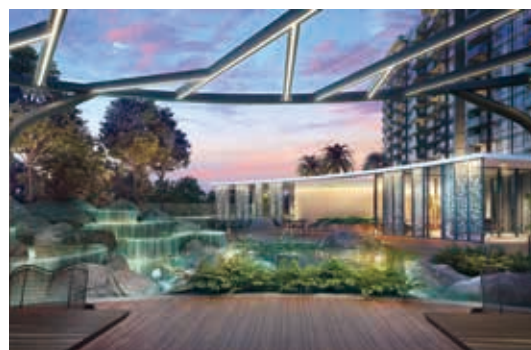
新加坡Hyll on Holland

Hyll on Holland為位於Holland Road之高端發展項目，擁有319個住宅單位，Holland Road為新加坡極具吸引力及聲譽良好之社區。本集團於該發展項目擁有80%權益，該發展項目應佔可售樓面面積約194,000平方呎。該項目之銷售已根據發展進度確認。於二零二三年三月三十一日，發展項目之應佔未入賬預售金額為港幣1,600,000,000元，預期該發展項目於二零二四年財年落成。