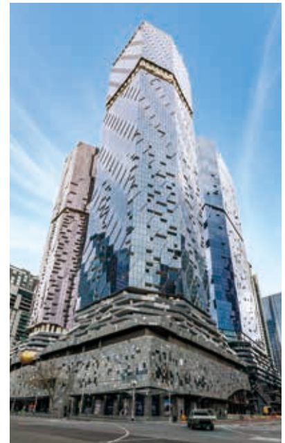
墨爾本West Side Place

於二零二三年三月三十一日，銀行貸款、票據及債券總額約為港幣32,300,000,000元，較二零二二年三月三十一日增加港幣1,079,000,000元或3.5%。