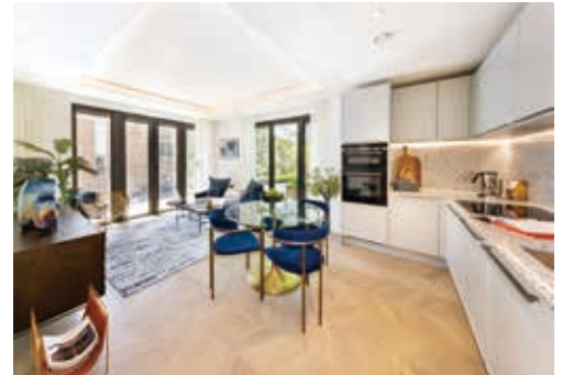
倫敦Hornsey Town Hall

位於北倫敦之Hornsey Town Hall為綜合用途重建項目，其將現有市政廳轉為設有公共空間之酒店／服務式公寓大樓及住宅部分，提供135個住宅單位（總可售樓面面積約為108,000平方呎）及11個社會／可負擔單位。該發展項目亦包括約45,500平方呎之商業及辦公室部分。於二零二三年三月三十一日錄得預售總值港幣167,000,000元。該發展項目於二零二三年財年落成及已開始交付，部分銷售額已於本財政年度確認為收益。預計交付流程將分階段持續至二零二四年財年。