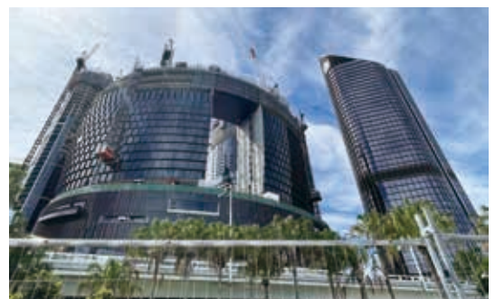
Queen's Wharf Brisbane建築地盤