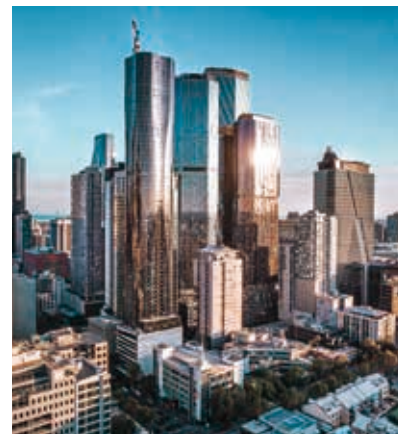
墨爾本West Side Place

本集團已與中電地產有限公司(「中電」)簽署協議，透過出售全資附屬公司訊安有限公司以代價港幣3,380,000,000元出售位於香港啟德之地皮(新九龍內地段第6607號)之寫字樓。預計大廈於二零二四年第三季度落成及交付。這將進一步改善本集團之資產負債率，並為其他業務發展計劃提供資金。