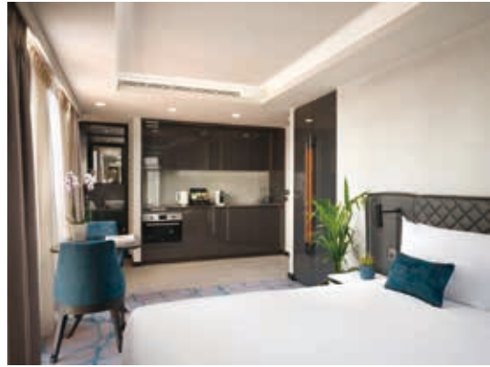
Dao by Dorsett West London

本集團之英國酒店收益總額按年上升66.7%至15,000,000英鎊，入住率按年上升26.1個百分點至71.8%，而平均房租則按年上升43.5%至122英鎊。隨著旅遊業恢復正常且英鎊之目前價值亦為英國旅遊提供額外誘因，英國酒店之前景明朗。