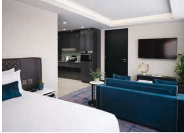
Dao by Dorsett West London