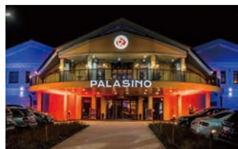
TWHE旗下所有賭場重塑品牌為「PALASINO」