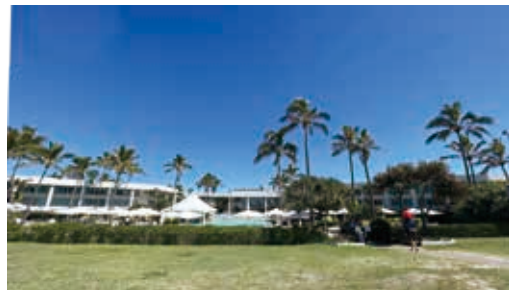
黃金海岸Sheraton Grand Mirage Resort