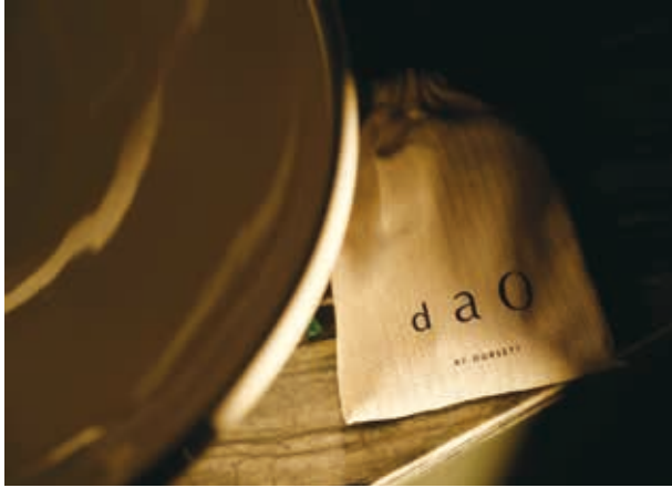
新推出之高檔「Dao by Dorsett」品牌