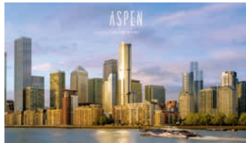
倫敦Aspen at Consort Place