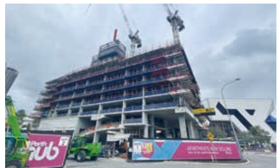
Perth City Link建築地盤