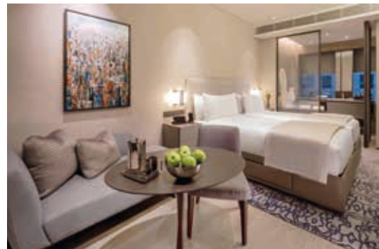
Dao by Dorsett AMTD Singapore

於二零二三年三月三十一日，本集團擁有9間發展中酒店，將提供約2,300間新客房。在該組合內，本集團於二零二二年七月推出公寓式酒店品牌「Dao by Dorsett」，為長住旅客提供創新和諧之公寓式酒店，並重塑本集團持有49%股權之Oakwood Premier AMTD Singapore品牌為Dao by Dorsett AMTD Singapore。全賴本集團酒店團隊努力不懈，我們於二零二三年財年呈報之經營業績有所改善，收益增長7.4%。本集團欣然透過Dao by Dorsett在中東及其他地區發展酒店管理服務，從而建立輕資產戰略。