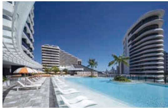
澳洲Dorsett Gold Coast

因此，於二零二三年財年，本集團於澳洲之酒店錄得收益總額約39,000,000澳元，入住率為73.7%及平均房租為399澳元，收益較二零二二年財年增長39.3%，而平均每間客房收益則增長39.3%。