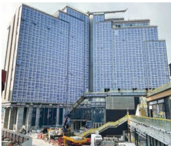
香港啟德帝盛酒店之建築地盤

位於大埔公路之畢架•金峰為住宅發展地盤。該項目提供62個單位及4幢洋房，總可售樓面面積約84,000平方呎，預期開發總值合共為港幣1,800,000,000元。該項目已於二零二二年三月底落成及推出。於二零二三年三月三十一日，餘下單位之預期開發總值約為港幣1,600,000,000元，其中約港幣594,000,000元已入賬列作已訂約銷售，並預期於二零二五年財年結算。餘下單位將按現狀出售。