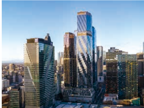
墨爾本West Side Place

Monument為位於640 Bourke Street之住宅發展項目，位於墨爾本商業中心區且鄰近West Side Place發展項目，提供一房、兩房及三房單位。該物業已獲准重建為總可售樓面面積約595,000平方呎之住宅項目，預期開發總值合共港幣2,500,000,000元，預期可提供約876個住宅單位。本集團仍在檢視將該項目轉為「租建」方案之機遇，討論仍在進行。