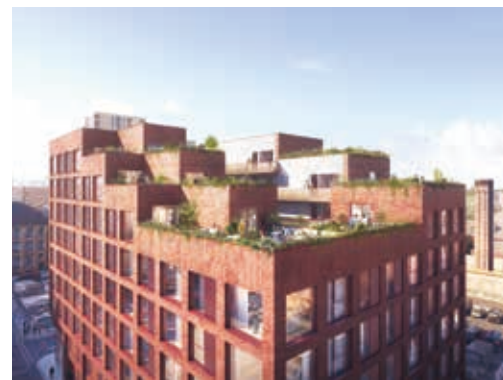
曼徹斯特New Cross Central