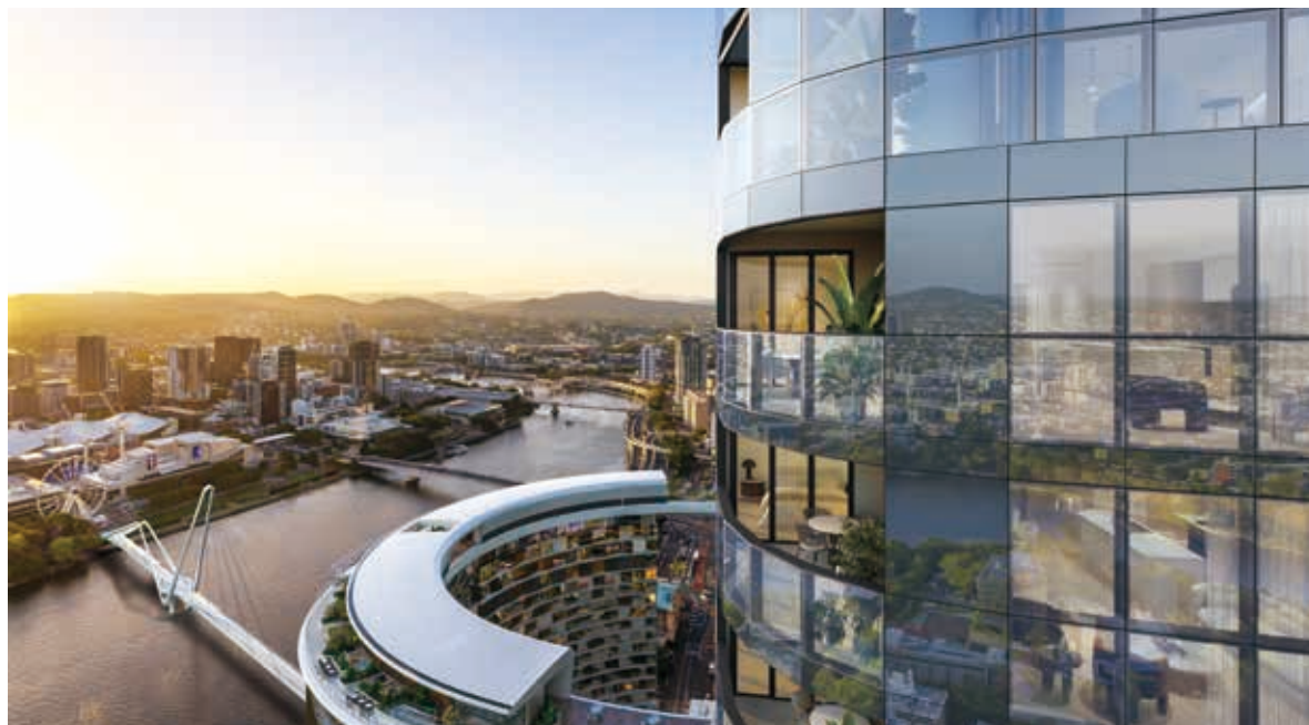
Queen's Wharf Brisbane之景觀

(i) 指非公認會計原則財務計量。其於下文「非公認會計原則財務計量」一節界定及與最接近之可資比較公認會計原則計量進行對賬。