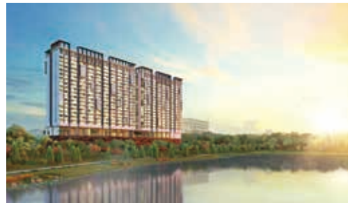
梳邦再也Dorsett Place Waterfront Subang