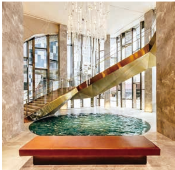
墨爾本麗思卡爾頓酒店大堂