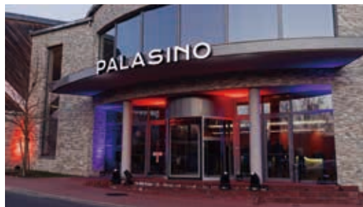
捷克共和國PALASINO Furth im Wald