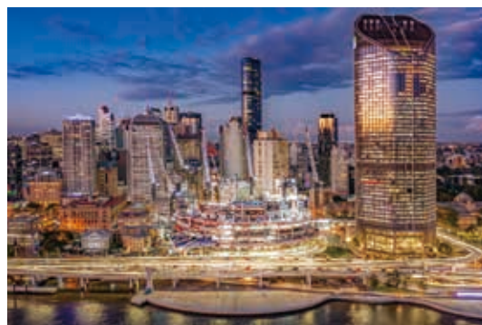
Queen's Wharf Brisbane之建築地盤

本集團擁有位於布里斯本綜合度假村之25%股權。本集團與The Star及周大福共同建設三間世界級酒店、設有貴賓室之高檔博彩設施、餐飲店及超過6,000平方米之零售及餐飲空間，將由全球領先之零售營運商DFS集團營運。