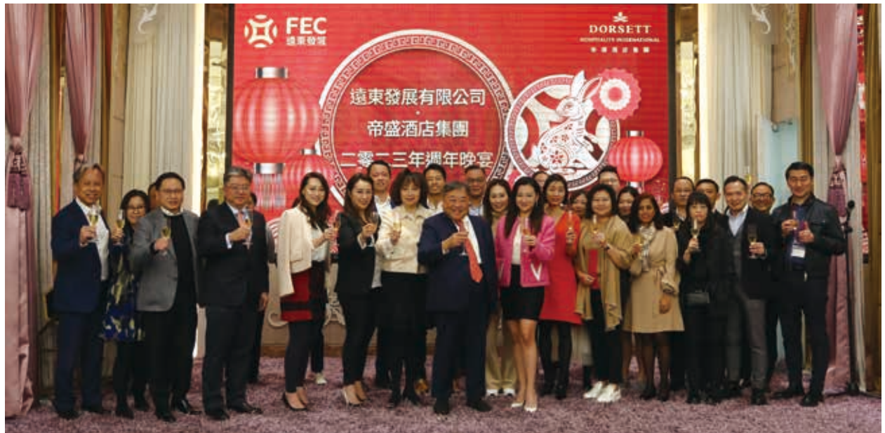
二零二三年週年晚宴

於二零二三年三月三十一日，本集團擁有約3,900名僱員。本集團向僱員提供周全之薪酬待遇及晉升機會，其中包括醫療福利、適合各層級員工職責及職能之在職及外部培訓。