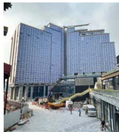
香港啟德帝盛酒店建築地盤