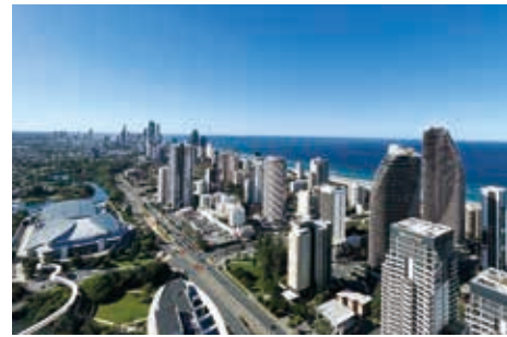
黃金海岸The Star Residences之景觀

The Star Residences位於黃金海岸世界級綜合度假村Broadbeach Island之中心地帶，為建有五幢樓宇之綜合用途發展項目。該項目為本集團、The Star及周大福於黃金海岸夥伴關係之延續，而本集團擁有其中33.3%權益。