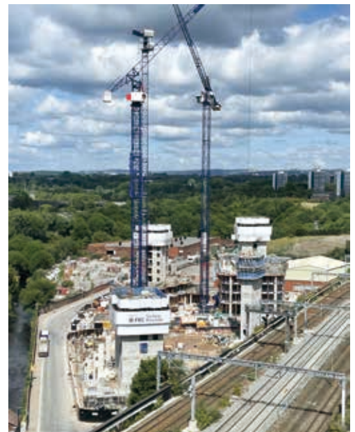
曼徹斯特Victoria Riverside建築地盤

Victoria North為位於曼徹斯特之大型重建發展項目，覆蓋面積逾390畝（相當於17,000,000平方呎），自維多利亞車站北上涵蓋New Cross、Lower Irk Valley及Collyhurst等鄰近地區。預期該項目於未來十年提供額外15,000間新房屋，提供優質住宅之最佳組合，同時使市中心擴展。該項目之願景為創建能充分利用該地區天然資源之一系列獨特且明確相連之社區。