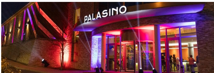
PALASINO Furth im Wald, 捷克共和国

我们正在积极研究资本市场交易的机会，以充分释放TWHE的潜力，为股东创造额外的价值。为达成这一目标，我们已根据上市规则第15项应用指引向香港联合交易所有限公司递交申请，而联交所已同意我们可进行这项潜在分拆，希望将TWHE旗下位于捷克的博彩业务以及位于德国和奥地利酒店业务进行分拆并单独上市。