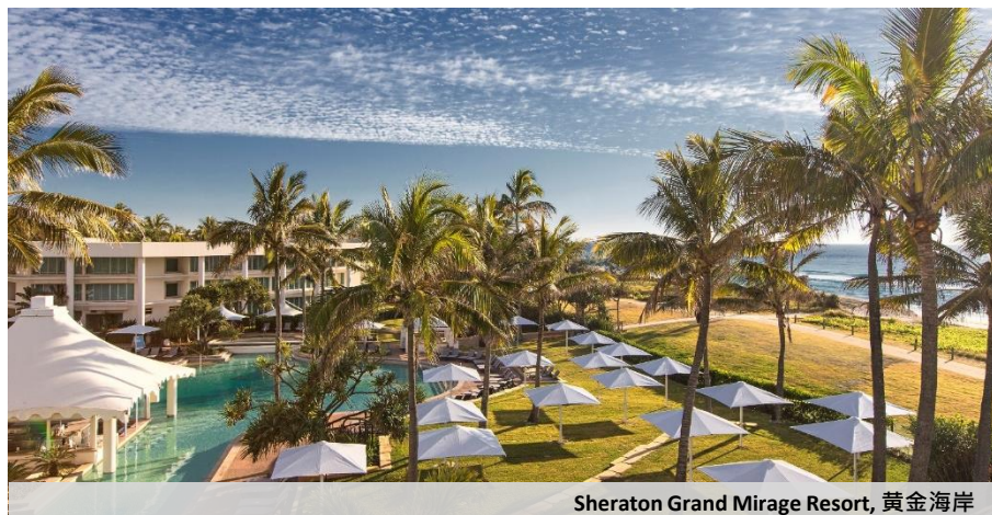
Sheraton Grand Mirage Resort, 黄金海岸

我们积极实施一系列债务削减措施以控制集团的资产和负债，并积极出售非核心资产来实现资产变现。于2023年6月，我们透过拥有25%权益之合营公司签订协议，以1.92亿澳元出售位于澳洲黄金海岸之Sheraton Grand Mirage Resort。