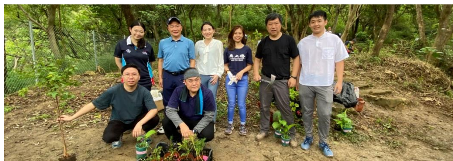
于中医药研究农场「D20 Roots」举行植树日

去年，我们通过香港办事处与香港高等教育科技学院中药系合作兴建中药研究中心并捐赠港币150万元及一块40,000平方呎的项目土地，为期三年。该地皮亦用作植树保育。这一措施不仅使我们能够为保护和加强该地区的生物多样性作出贡献，同时亦为文化保育提供了机会。自去年以来，参与该项目的学生在保护区内发现了20种中草药。这一发现启发了很多学生，帮助他们学习如何保育中药文化的同时，亦融合商业理念到中医推广，推动中医药现代化，将中医发展发扬光大。