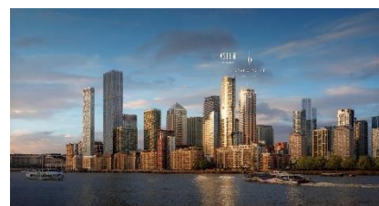
Aspen at Consort Place, 倫敦