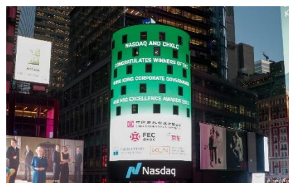
遠東發展公司標誌展示於紐約時代廣場的納斯達克大廈外牆上