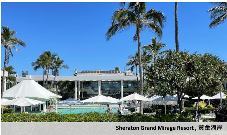
Sheraton Grand Mirage Resort, 黃金海岸

在2023年6月，我們與擁有25%權益之合營公司簽訂協議，出售位於澳洲黃金海岸Sheraton Grand Mirage Resort。這筆交易金額為1.92億澳元，並於2023年11月成功完成。而此次出售我們預計將實現5800萬港元的稅前收益。