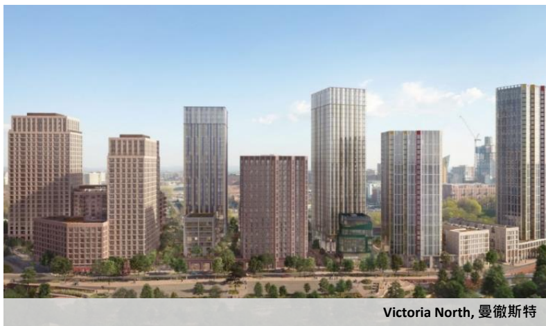
Victoria North, 曼徹斯特

在2023年8月，本集團達到了一個重要里程碑，獲得了大曼徹斯特聯合管理局和特拉福德都會區議會選為首選投標者作為開發合作夥伴，並計劃在大曼徹斯特警察總部舊址上，興建耗資逾三億英鎊之綜合開發項目。同月，我們亦聯同曼徹斯特市議會獲批4800間新房屋規劃，作為下階段Victoria North之部分發展項目。