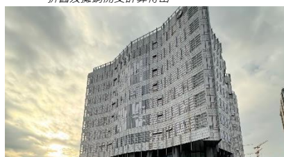
香港啟德發展項目 – 辦公室