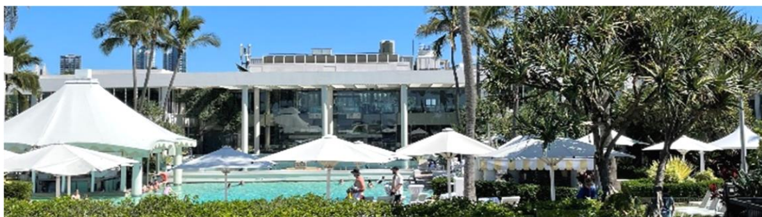
Sheraton Grand Mirage Resort, 澳洲黄金海岸

于2024年财年，我们出售非核心资产，所得款项总额约为港币12亿港元。具体而言，我们于2023年4月出售位于新西兰的停车场；于2023年9月完成出售马来西亚之Dorsett Bukit Bintang之余下单位，代价为1.2亿马币；以及于2023年11月透过其拥有25%权益之合营公司，以 1.92 亿港元完成出售于澳洲黄金海岸之Sheraton Grand Mirage Resort。展望未来，我们将继续致力于探索及发掘非核心资产的进一步价值。