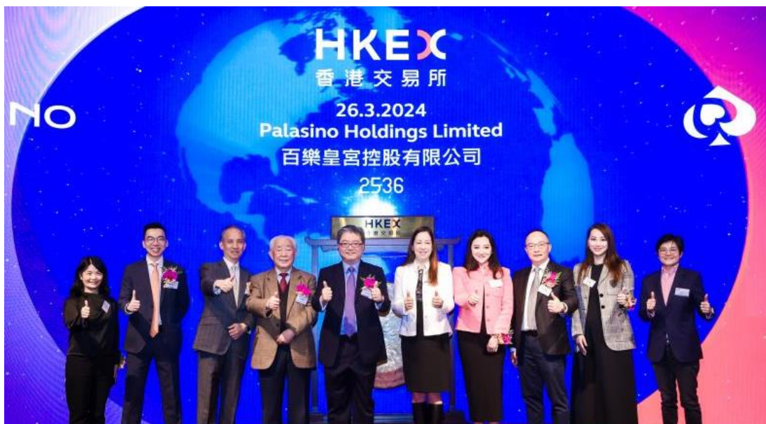
Palasino 于香港交易所举行上市仪式

2024年3月26日，Palasino Group持有本集团博彩业务及管理业务，已成功独立于联交所上市。于2024年4月行使部分首次公开发售之超额配股权后，本集团于Palasino Group拥有之股权由73.21%下降至72.07%。我们期待日后的飞跃发展。