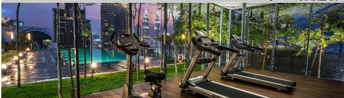
Dorsett Bukit Bintang, 马来西亚