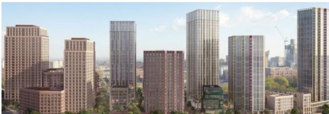
Red Bank Riverside, 曼徹斯特

預期Red Bank Riverside的地基工程於2025年財年動工，於2027年財年至2030年財年分階段竣工。Falcon為Red Bank Riverside住宅大廈之一，已於2024年3月推出，提供189個住宅單位，總可售樓面面積約為131,000平方呎及預期開發總值為港幣6.53億元。另一Red Bank Riverside住宅大廈Kingfisher已於2024年8月中推出，提供322個住宅單位，總可售樓面面積約為230,000平方呎及預期開發總值為港幣12億元。