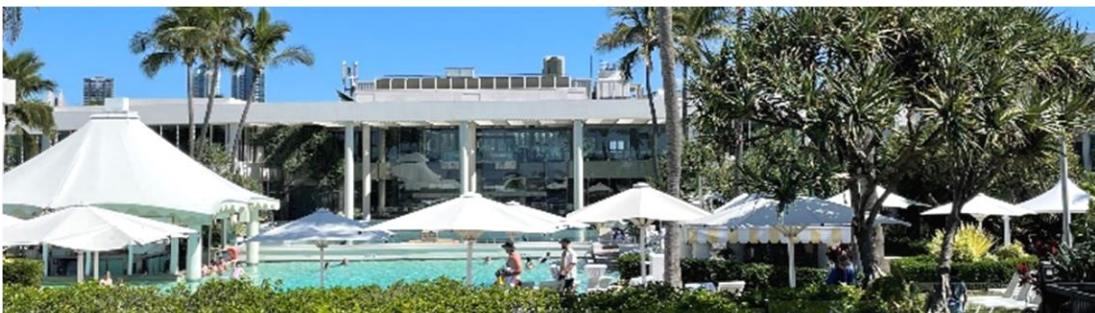
Sheraton Grand Mirage Resort, 澳洲黃金海岸

於2024年財年，我們出售非核心資產，所得款項總額約為港幣12億港元。具體而言，我們於2023年4月出售位於新西蘭的停車場；於2023年9月完成出售馬來西亞之Dorsett Bukit Bintang之餘下單位，代價為1.2億馬幣；以及於2023年11月透過其擁有25%權益之合營公司，以 1.92 億澳元完成出售於澳洲黃金海岸之Sheraton Grand Mirage Resort。展望未來，我們將繼續致力於探索及發掘非核心資產的進一步價值。