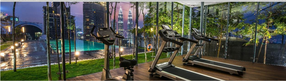
Dorsett Bukit Bintang, 馬來西亞