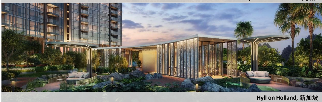
Hyll on Holland, 新加坡