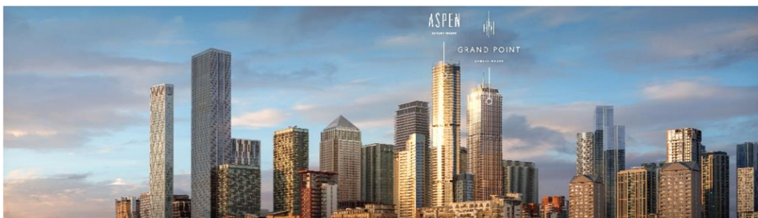
Aspen at Consort Place, 倫敦

Hyll on Holland為位於新加坡Holland Road的極具吸引力及聲譽良好之社區高端發展項目，擁有319個住宅單位。於2024年3月31日，319個住宅單位均已售出，應佔未入賬預售金額約為港幣5.26億元。Hyll on Holland 已於2024年6月開始交付。